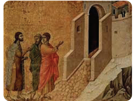
<Jesus and the two disciples On the Road to Emmaus , by Duccio >

예수님은 문간에서 우리의 문을 두드리십니다. 우리가 예수님을 우리 삶의 문지방 안으로 들일 수 있도록 ... 이는 엠마오로 가던 사도들처럼, 우리와 함께 묵을 것을 예수님께 청하면서 우리 마음의 문을 여는 것을 의미합니다. 우리가 신앙의 문을 통과할 수 있도록, 우리가 우리 믿음의 이유를 이해하게 되는 지점까지 주님이 우리를 몸소 데려다 주실 수 있도록, 그래서 우리가 앞으로 나아가 다른 이들에게 주님을 선포할 수 있도록 말입니다. 신앙이란 주님과 함께 머물겠다는, 주님과 함께 살겠다는, 주님을 형제 자매와 나누겠다는 결심을 의미합니다.