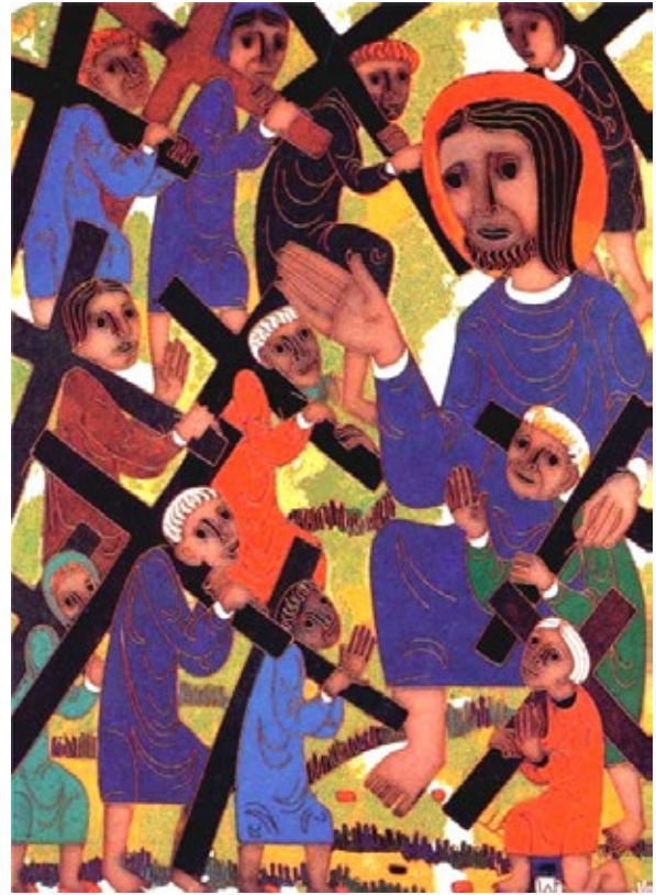
에기노 바이너트 작

어떤 사람이 예수님께 “주님, 구원받을 사람은 적습니까?” 하고 물었다. 예수님께서 그들에게 이르셨다. “너희는 좁은 문으로 들어가도록 힘써라. 내가 너희에게 말한다. 많은 사람이 그곳으로 들어가려고 하겠지만 들어가지 못할 것이다.” (루카 13,23-24)