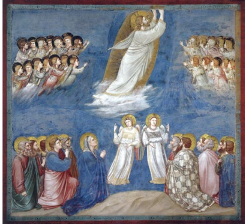
〈그리스도의 승천〉, 지오토 디 본도네

예수님께서서는 그들을 베타니아 근처까지 데리고 나가신 다음, 손을 드시어 그들에게 강복하셨다. 이렇게 강복하시며 그들을 떠나 하늘로 올라가셨다. (루카 24, 48-51)