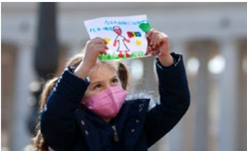
한 소녀가 3월 13일 성 베드로 광장에서 평화의 깃발을 들고 있는 프란치스코 교황 그림을 들고 서 있다. 교황은 이날 폭력을 지지하는 일은 주님을 모독하는 것이라고 강조했다.

프란치스코 교황이 우크라이나에서 벌어지고 있는 전쟁의 종단을 다시 한번 촉구하며 그 누구도 주님의 이름으로 폭력을 쓰거나 정당화시키면 주님의 이름을 모독하는 것이라고 강조했다.