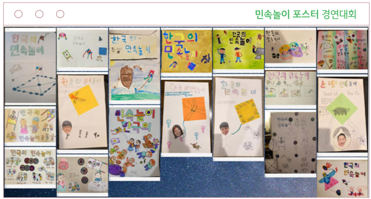
민속놀이 포스터 경연대회