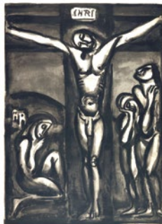
〈서로 사랑하여라〉, 조르주 루오

“내가 너희에게 새 계명을 준다. 서로 사랑하여라. 내가 너희를 사랑한 것처럼 너희도 서로 사랑하여라. 너희가 서로 사랑하면, 모든 사람이 그것을 보고 너희가 내 제자라는 것을 알게 될 것이다.” (요한 13,34-35) 예수께서는 공생활 중에 사람들에게 하느님 나라의 복음을 선포하시면서 이제 그 나라가 멀리 있는 것이 아니라 사람들 가운데 있음을 알려주기 위해 사랑을 보여주셨다.