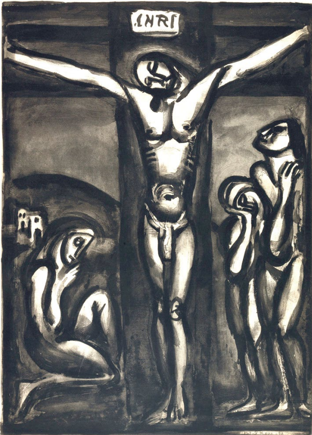
〈서로 사랑하여라〉, 조르주 루오, 동판화, 파리, 프랑스.