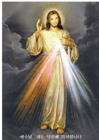
〈하느님의 자비 상본〉