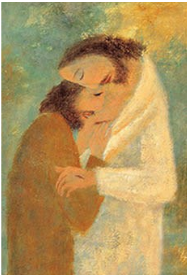
〈나의 주님, 나의 하느님〉, 김옥순 수녀 作