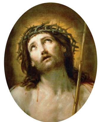
〈이 사람을 보라〉, 귀도 레니

예수님의 수난을 묵상하는 주님 수난 성금요일에는 오랜 전통에 따라 성찬 전례를 거행하지 않고, 말씀 전례와 십자가 경배, 영성체로 이어지는 주님 수난 예식을 거행한다. 금육과 단식을 함께 지키고, 예절 중에 예루살렘 성지를 위한 특별헌금이 있다.