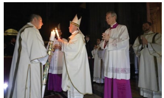
〈성 베드로 대성전 파스카 성야 미사〉

파스카 성야의 모든 예식은 주님께서 부활하신 거룩한 밤을 기념하여 교회 전례에서 가장 성대하게 거행한다. 하느님께서 이스라엘 백성을 이집트의 종살이에서 해방시켜 주셨듯이, 예수 그리스도를 통하여 인류를 죄의 종살이에서 해방시켜 주신 날을 기념한다. 따라서 교회는 장엄한 전례로, 죽음을 이기시고 참된 승리와 해방을 이루신 예수 그리스도의 부활을 맞이한다. 빛의 예식, 말씀 전례, 세례 예식, 성찬 전례로 구분되며 파스카 성야 전례의 절정인 성찬 전례를 통해 공동체는 부활하신 주님이 마련한 잔치에 참여한다.