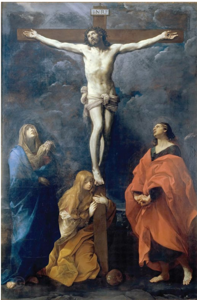
〈십자가에 못 박히신 그리스도〉, 귀도 레니, 1617년, 볼로냐 국립 미술관, 이탈리아

“그리스도는 우리를 위하여 죽음에 이르기까지, 십자가 죽음에 이르기까지 순종하셨네.”