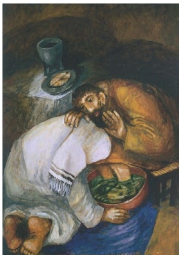
〈제자들의 발을 씻어 주는 예수〉, 지거 퀴더

“그리스도께서는 특별히 당신의 파스카 신비로 인류를 구원하시고, 하느님을 완전하게 현양하는 업적을 이루셨다. 곧 당신의 죽음으로 우리 죽음을 없애시고 당신의 부활로 우리 생명을 되찾아 주셨다.” 『전례주년과 전례력에 관한 일반 규범』, 18항