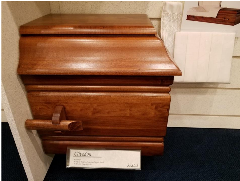
Clivedon – Poplar: $3095