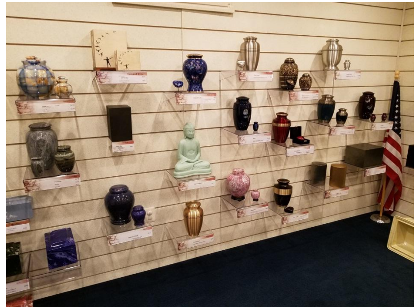
가격 범위: $45 - $1,849