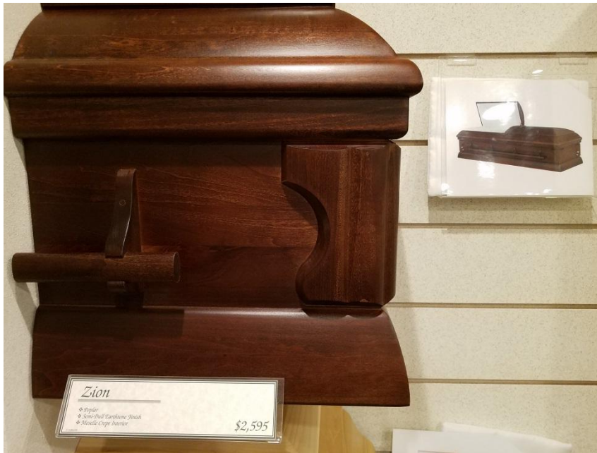
Zion – Poplar: $2595