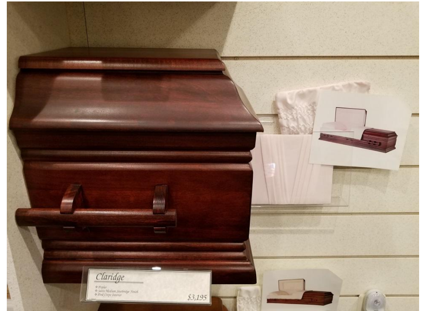
Claridge – Poplar: $3195