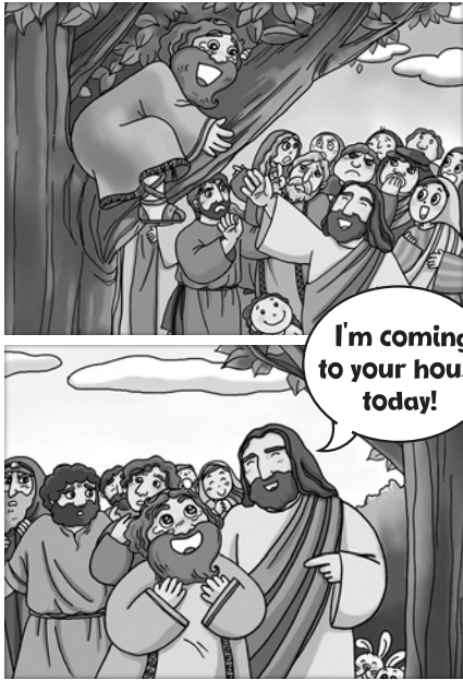
<오마리아 주일복음/바오로딸 콘텐츠>

In today's Gospel reading, we hear about a tax collector, Zacchaeus, who was curious about Jesus. Jesus saw that this was a chance for him to turn from his evil ways, so He called him down from his perch in the tree and said He was going to visit him at his house.