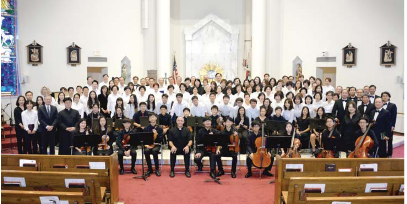
본당 승격 23주년 기념 <사랑 나눔 음악회>