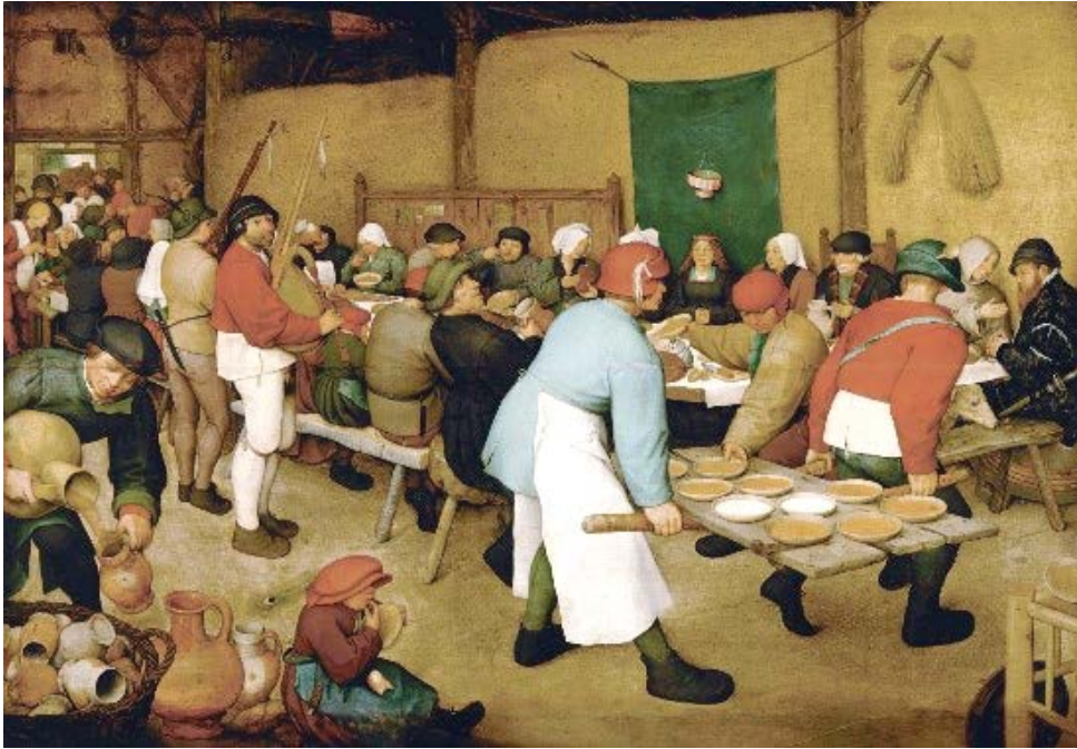
〈농가의 결혼식〉, 피터 브뤼겔

“네가 잔치를 베풀 때에는 오히려 가난한 이들, 장애인들, 다리저는 이들, 눈먼 이들을 초대하여라. 그들이 너에게 보답할 수 없기 때문에 너는 행복할 것이다. 의인들이 부활할 때에 네가 보답을 받을 것이다.” (루카 14,13-14)