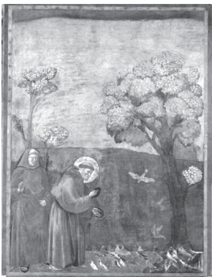
〈새들에게 설교하는 성 프란치스코〉, 조토 디 본도네

프란치스코 교황, “피조물 보호를 위한 기도의 날” 제정을 위한 서한(2015년) 중