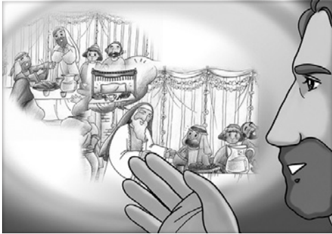
<오마리아 수녀의 주일복음 그림/바오로딸 콘텐츠>

In today's Gospel reading, Jesus was watching to see where the people sat when they were guests at a dinner. Some people thought they were important so they sat in the more important places. Jesus saw that they were