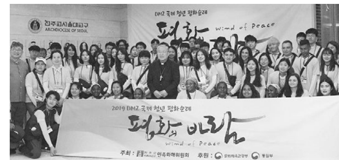
▲ “2019 평화의 바람” 순례 참석자들과 서울대교구장 염수정 안드레아 추기경

자신을 성찰하면서 우리의 삶에 평화가 얼마나 소중한지 체험하기를 바란다”고 말했다. 이어 프란치스코 교황의 요청을 되새기며 “인류 공동의 집(Common Home)인 지구, 자연과 평화롭게 살아갈 수 있는 방법을 찾아야 한다”고 말했다.