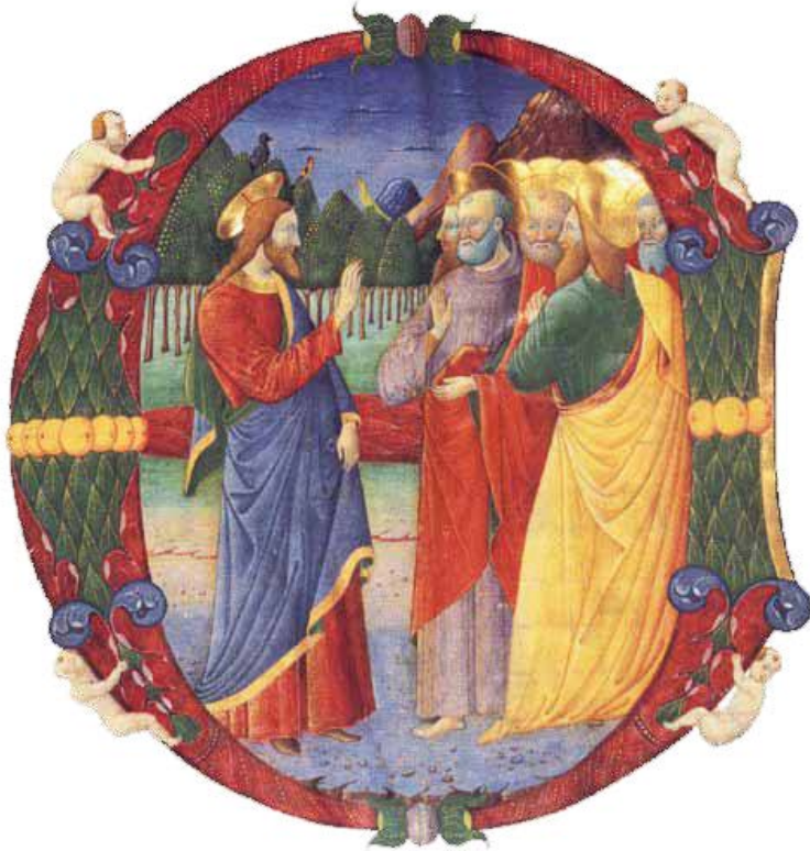
〈제자들을 파견하시는 예수님〉, 15세기, 채색 삽화, 모르건 도서관, 뉴욕

그런데 어떤 사람이 예수님께 “주님, 구원받을 사람은 적습니까?” 하고 물었다. 예수님께서 그들에게 이르셨다. “너희는 좁은 문으로 들어가도록 힘써라. 내가 너희에게 말한다. 많은 사람이 그곳으로 들어가려고 하겠지만 들어가지 못할 것이다. (루카 13,23-24)