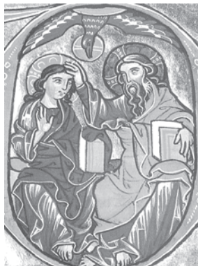
〈삼위일체〉, 11세기 경

영원한 생명의 책을 들고 있는 성부께서는 한 손으로 성자를 축복하고 계시며, 성자께서는 온 세상을 향해서 강복을 주고 계신다. 위에는 성령께서 비둘기 모양으로 내려오면서 성부와 성자를 감싸고 계신다. 삼위는 서로 구별되면서도 원 안에서 하나를 이루고 있다.