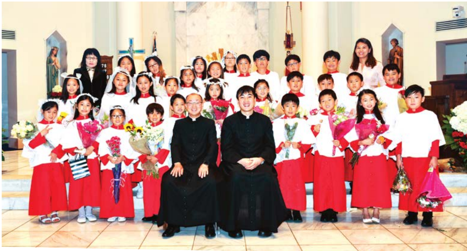
2018년 주일학교 첫 영성체 예식