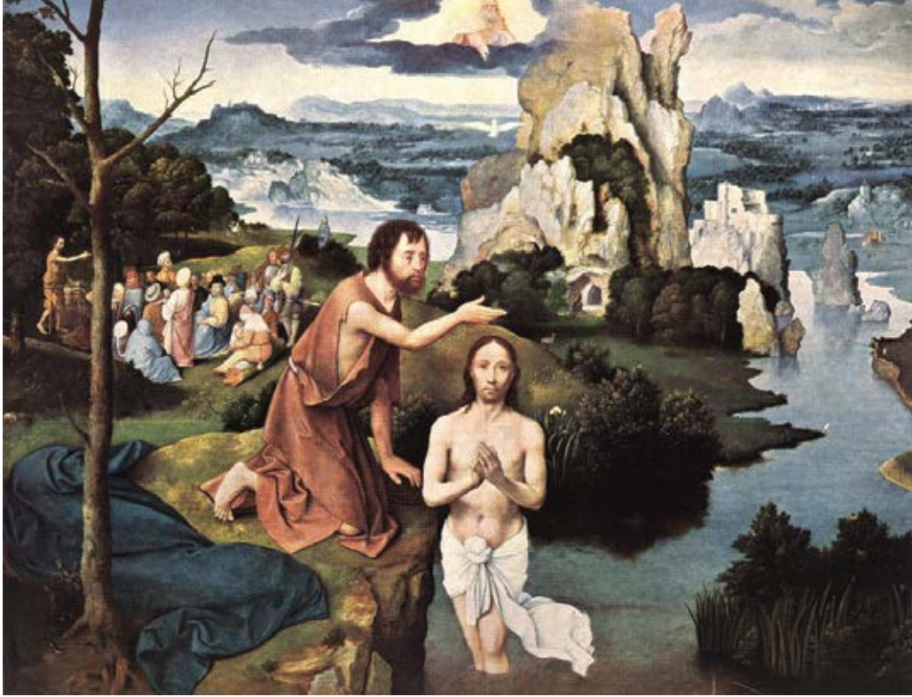
파티니르(Joachim Patinir), <세례를 받으시는 예수님>

“나보다 더 큰 능력을 지니신 분이 내 뒤에 오신다. 나는 몸을 굽혀 그분의 신발 끈을 풀어 드릴 자격조차 없다. 나는 너희에게 물로 세례를 주었지만, 그분께서는 너희에게 성령으로 세례를 주실 것이다.” (마르 1,7-8)