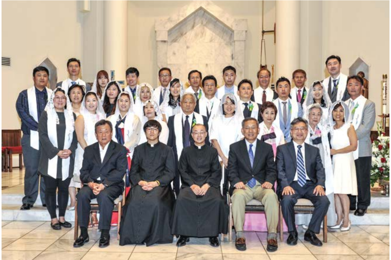
성 정 바오로 천주교회 제76차 영세자들