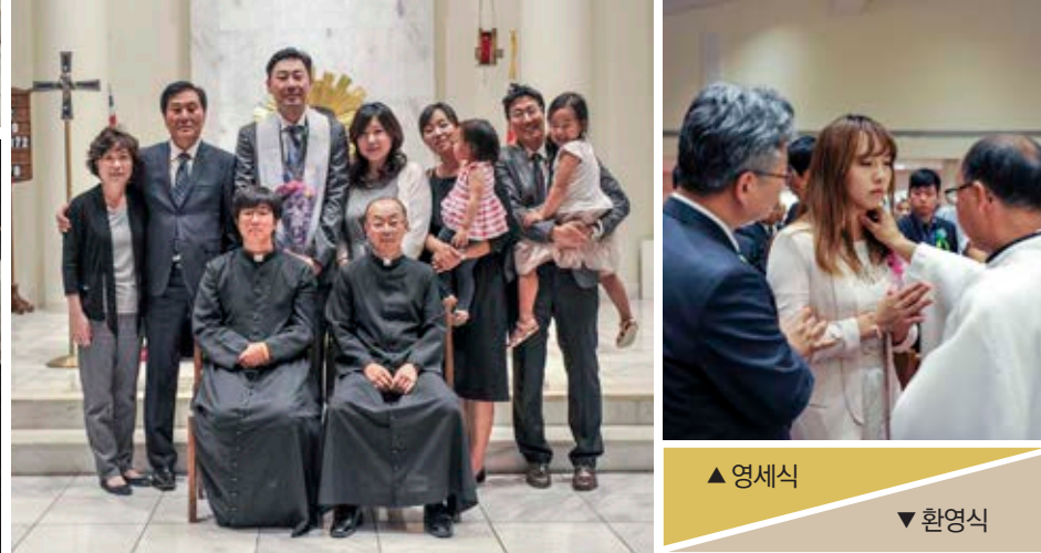
▲ 영세식 ▼ 환영식